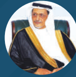
سعادة الأستاذ الدكتور محسن بن علي فارس الحازمي عضو