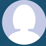
صاحبة السمو الملكي الأميرة/ أريج بنت تركي بن ناصر بن عبدالعزيز آل سعود عضو